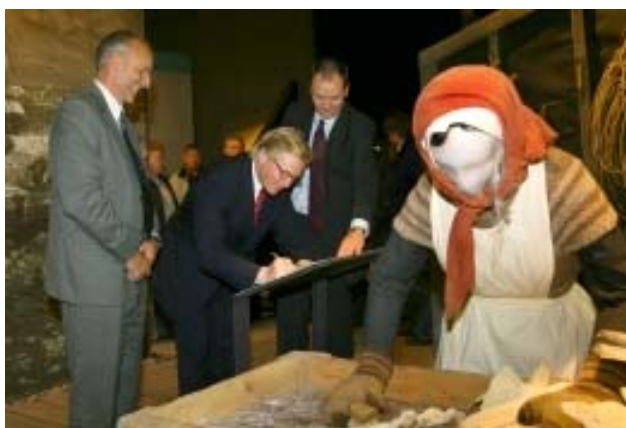
Kontraktene ble underskrevet på saltfiskmuseet i Grindavik

Opprinnelig var TM et rent sjøforsikringselskap, men er nå et diversifisert selskap med alle skadeforsikringsbransjer. Innenfor fiskebåtforsikring har TM forsikret ca. halvparten av den islandske flåten og har et premievolum som omtrent tilsvarer Møretrygd.